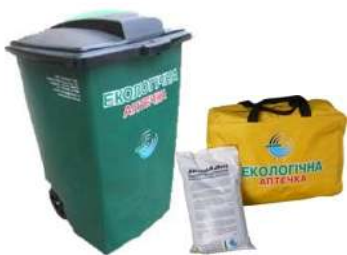
Екологічні аптечки «Еконад»