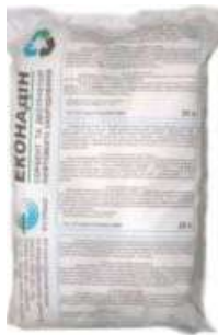
Сорбент для збору нафти «Еконадін»