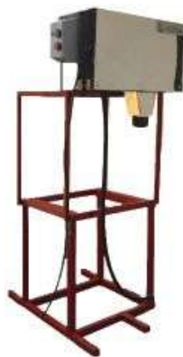
Скіммери для збору нафтопродуктів