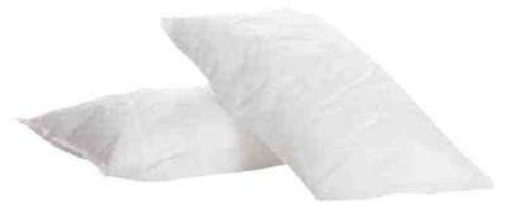
Комплекти для збору нафти і ліквідації розливів нафтопродуктів