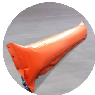
Продукція від повені