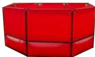
Ємності для зберігання нафтопродуктів