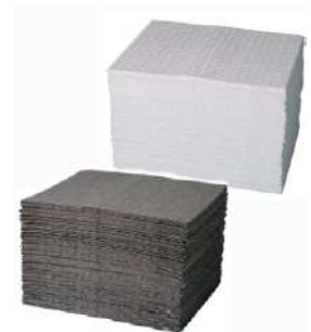
Сорбуючі бони, серветки і мати для збору нафти