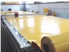
1 Cutting Material