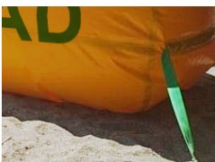
4 Accessories Assembly