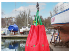
5 Proof Load Testing