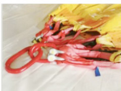
4 Accessories Assembly