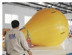
3 Air Tightness Inspection