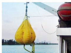
5 Proof Load Testing