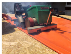
2 HF Welding